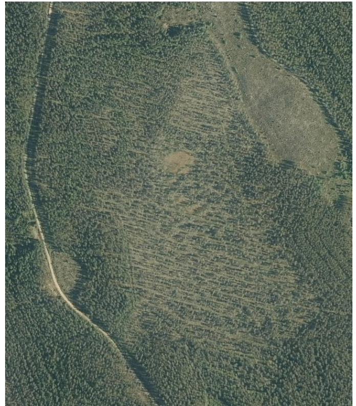
Ilmakuva ennallistettavasta alueesta vuodelta 1939 (vas.) ja vuodelta 2019 (oik.). Kartalla ja ilmakuvilla ei ole MLL:n julkaisulupaa painotuotteessa.